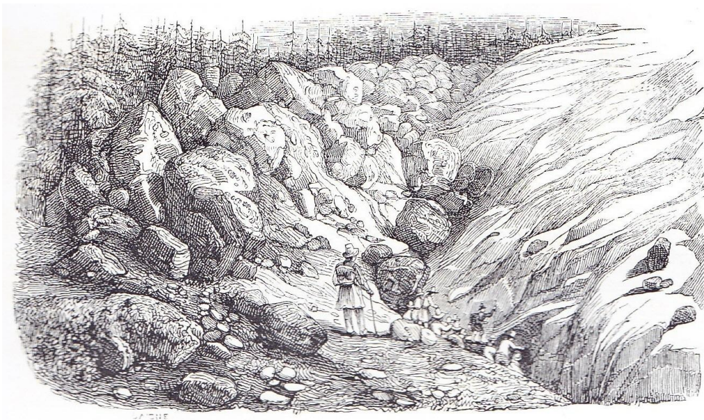
GLACIER DE GRINDELWALD